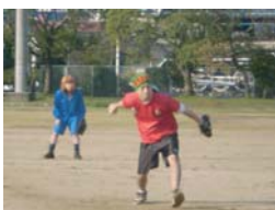
ピッチャーむっくん