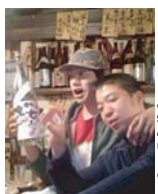
はくだん 陶山店長

ポッポのトイレがまっかつか!!カーブガンバレ!ポッポはカーブグッズ集めてます!!ご家庭で眠っている赤ヘルグッズありましたらぜひポッポへお待ちしてます!