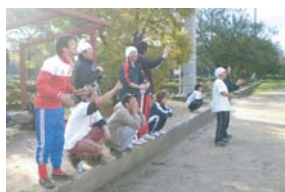
マスターのゲキがとぶ！