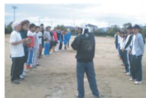
やっぱりは堀さんで