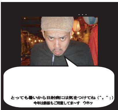
とつても暑いから日射病には気をつけてね(。^。^) 今年は鉄板も用意してま〜す ウホッ