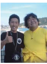
ベツチャー 大塚店長

早いものですね～もう一年が終わります。去年食べたベツチャーの豚しゃぶおいしかったなあ～是非忘年会はベツチャーへ