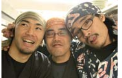
かわいさ満天☆三人衆