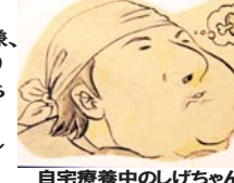
自宅療養中のしげちゃん