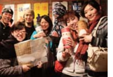
たか君おくさまとお友達♪