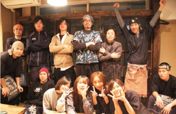
いっとくのおかん、いっとくありがとうございます

12月12日(金)尾道渡し場たまがんぞうは、おかげさまで一周年を迎えることができました。たくさんのお客様と業者の方に支えられいっとく最年少の満一歳、ここから両足でしっかり歩いて成長あるのみ！！たまがんぞう、いきますっ！！！！