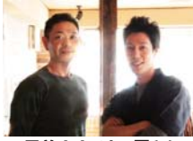
男前！！こまつ屋さん

無事一周年を迎えることができたのも、ご来店頂いたお客様、応援して頂いた業者の方、そしてたまがんぞうと一緒に盛り上げてくれたスタッフのみんなのおかげです。感謝の気持ちを胸に、今年も皆様に喜んで頂ける店を目指し顔晴ります！2009年もたまがんぞうそしていっとくグループをよろしく願っています。