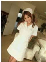
ベツチャー 大塚店長

あけましておめでとうございます。2009年もベツチャーをよろしくお願ひします。お節料理で食べ過ぎた方はベツチャーのお料理でお口と体を癒しにキテね(o^v^o)