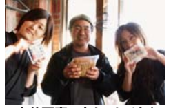
丸豆腐の丸ちゃんです♪